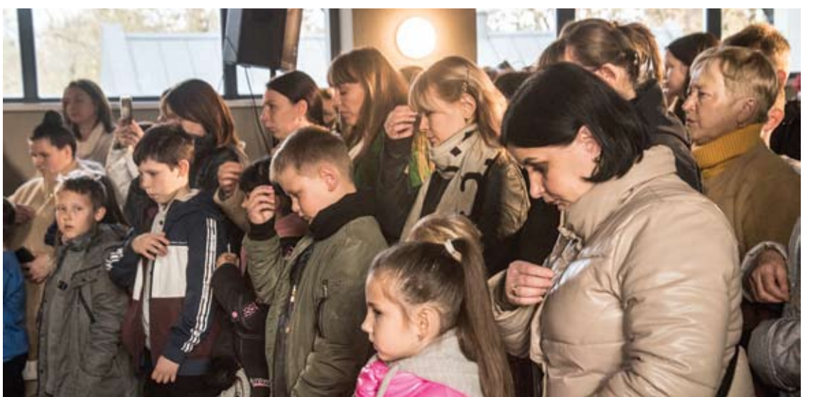
Į Šv.mišias suvažiavo ir ukrainiečių iš Vilniaus, Kauno, Klaipėdos, Panevėžio.