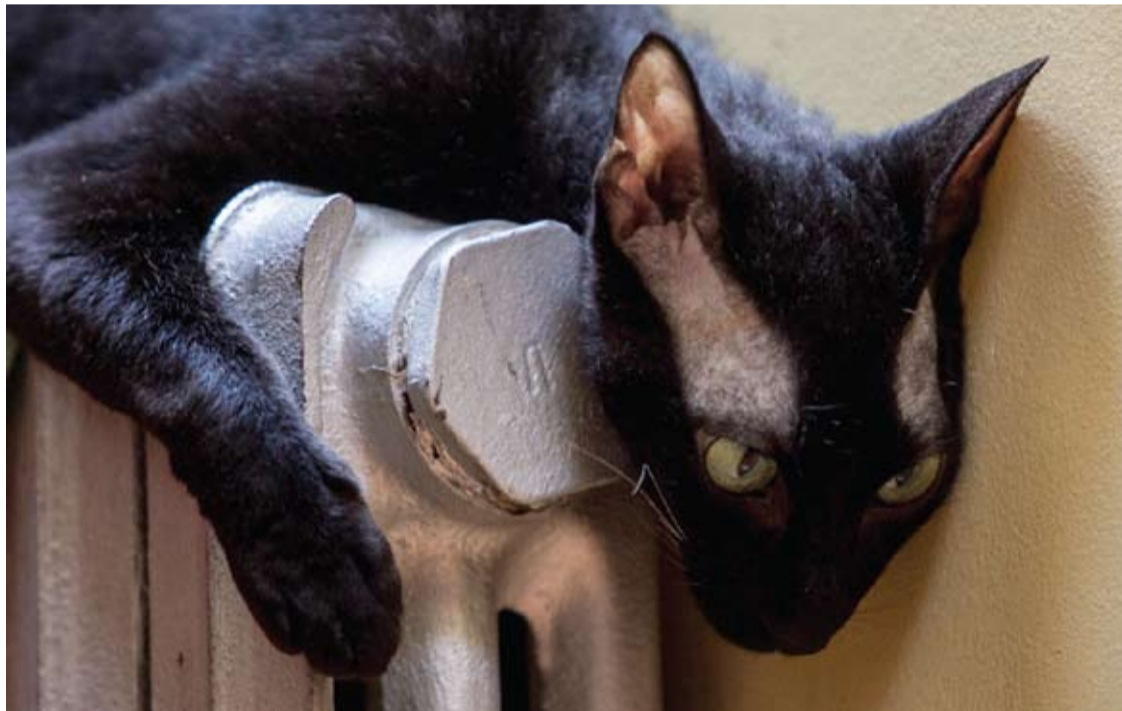
Šiomet centralizuoto šildymo sezoną Anykščiai pradėjo praėjusį trečiadienį, o Vilnius - vakar.

Šiais metais drastiškai pakilus kainoms, anykštėnai suskubo pildyti dokumentus būsto šildymo kompensacijai gauti.